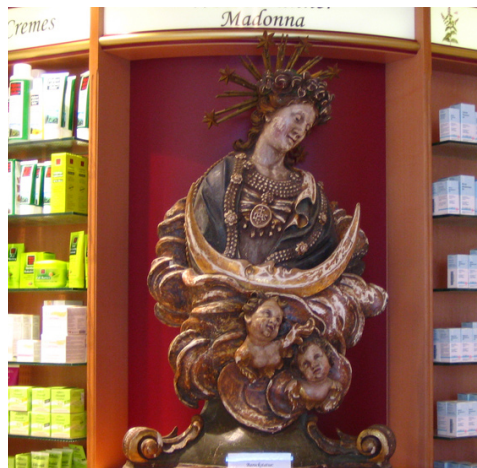
Wertvolles Kulturgut: Die Wessobrunner Madonna stammt aus dem 18. Jahrhundert

ALEXANDER ROEDER: Dazu muss man etwas über unsere Beziehung zueinander wissen. Christian ist drei Jahre älter als ich und maßgeblich dafür verantwortlich, dass auch ich Apotheker geworden bin. Wir stammen aus einer